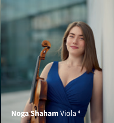
Noga Shaham Viola 4